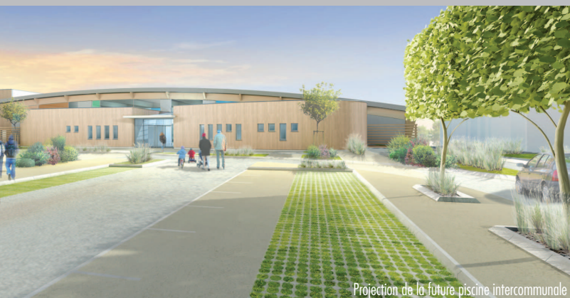
Projection de la future piscine intercommunale

grande attention est portée aux coûts de fonctionnement. Les solutions pour le chauffage de l'eau et du bâtiment ont été passées au crible.