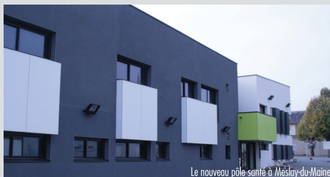
Le nouveau pôle santé à Meslay-du-Maine