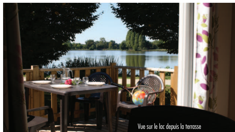
Vue sur le lac depuis la terrasse

En dehors de nos frontières départementales, la qualité des plans d'eau et l'accueil réservé aux pêcheurs sont un des points forts de la destination "Mayenne". Pour répondre à l'exigence de cette clientèle, des postes de pêche aménagés, destinés prioritairement aux locataires des mobil homes, viendront compléter l'offre proposée et les opérations de communication, visant à assurer le remplissage du camping, sont orientées vers ce public.