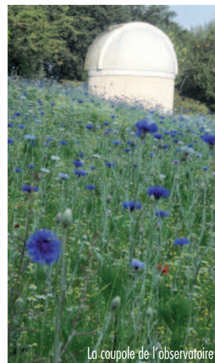
La coupole de l'observatoire

Fin février 2013, la pose d'un panneau concrétisait le travail accompli et consacrait officiellement le site en tant que "refuge LPO - Ligue pour la Protection des Oiseaux".