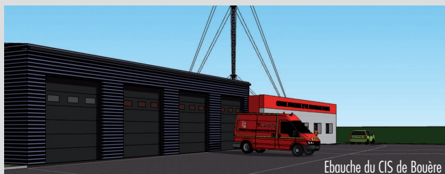
Ebauche du CIS de Bouère

La construction d'un nouveau centre de secours à Bouère a débuté et fait partie d'un vaste plan de mise à niveau des structures du SDIS 53.