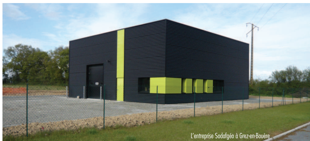
L'entreprise Sodafgéo à Grez-en-Bouère

Mais c'est à Ballée qu'on trouve la plus grosse opération immobilière, avec une extension de 9 000 m 2 réalisée en octobre 2012 par Celloplast, s'ajoutant à la construction d'un pôle logistique de 13 000 m 2 (en 2009), venant concrétiser l'ancrage de la société sur sa commune historique.