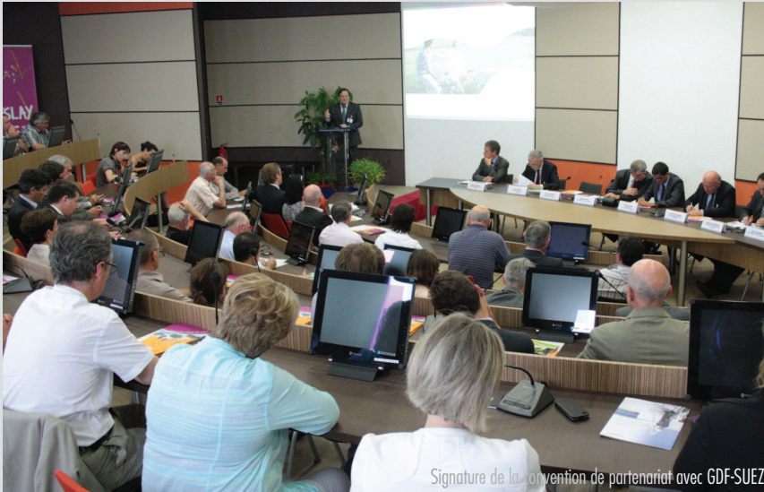
Signature de la convention de partenariat avec GDF-SUEZ

une mobilisation en faveur de la maîtrise de la demande énergétique et de la production d'énergie renouvelable, et une volonté de réduire la dépendance en énergies fossiles.