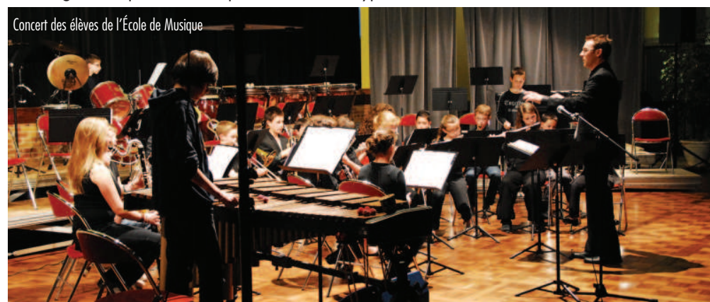
Concert des élèves de l'École de Musique

Nouveauté 2014 : un déplacement groupé pour assister à un concert prestigieux (Nantes ou Angers) avec en prime, une session de formation d'une heure afin de décrypter le futur concert.